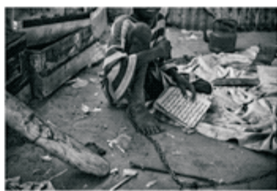
PRÉMIO ESTAÇÃO IMAGEM 2016 VIANA DO CASTELO